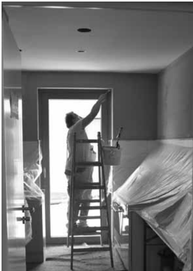
Letzte Handgriffe an der Küche

Wer das Melanchthonhaus schon einmal besucht hat, weiß, dass wir uns in der Küche mit Provisorien behelfen. Die alten Möbel waren leider nicht mehr verwendbar. Aus hygienischen Gründen müssen wir neue Möbel aus Edelstahl besorgen. Für die großen Veranstaltungen wird eine Spülmaschine benötigt, mit der in kurzer Zeit viel gespült werden kann. Darauf warten unsere Ehrenamtlichen schon lange! Die Kosten betragen insgesamt 19.950 €. Wir rechnen mit Fördermitteln in Höhe von 13.000 €. 6.950 € müssen wir selbst aus Spenden aufbringen.