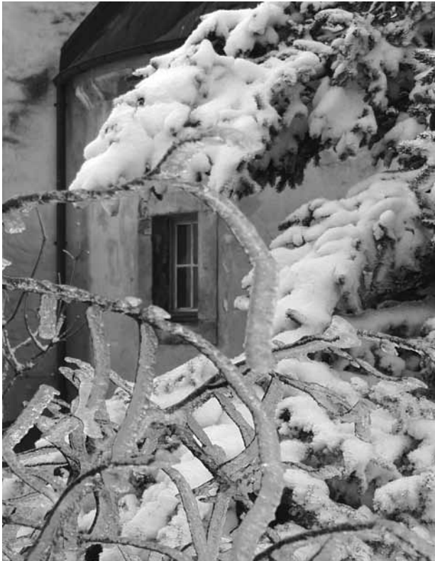
Südliches Chorfenster der Kirche St. Michael zu Hohendorf

Serba Droschka Hetzdorf Klengel Silberthal Trotz