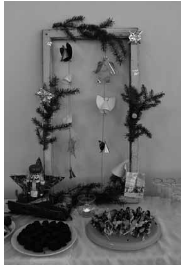
Gastfreundschaft zur Kirche Kunterbunt

RT 0812 Spende Küche Melanchthonhaus (und Ihre Adresse, wenn Sie eine Spendenbescheinigung wünschen)