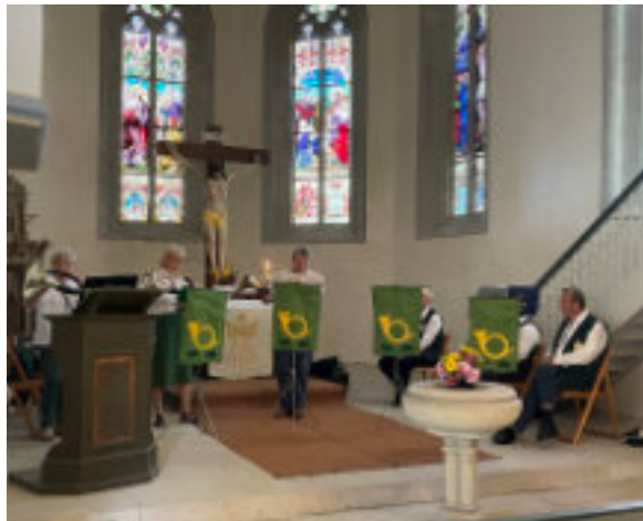
Jagdhorngruppe „Hoher Flug“

DANKE an die Organisatoren und wir freuen uns schon auf den 6. Dezember mit dem nächsten kleinen Konzert.